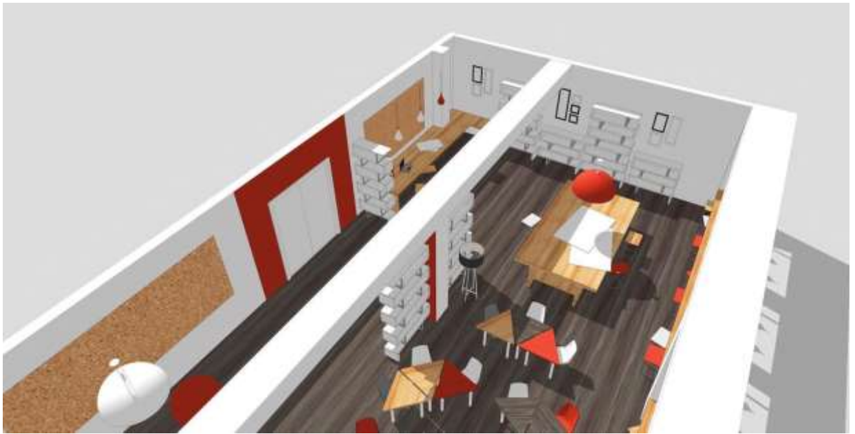
Аудитория: картины, выставка достижений.