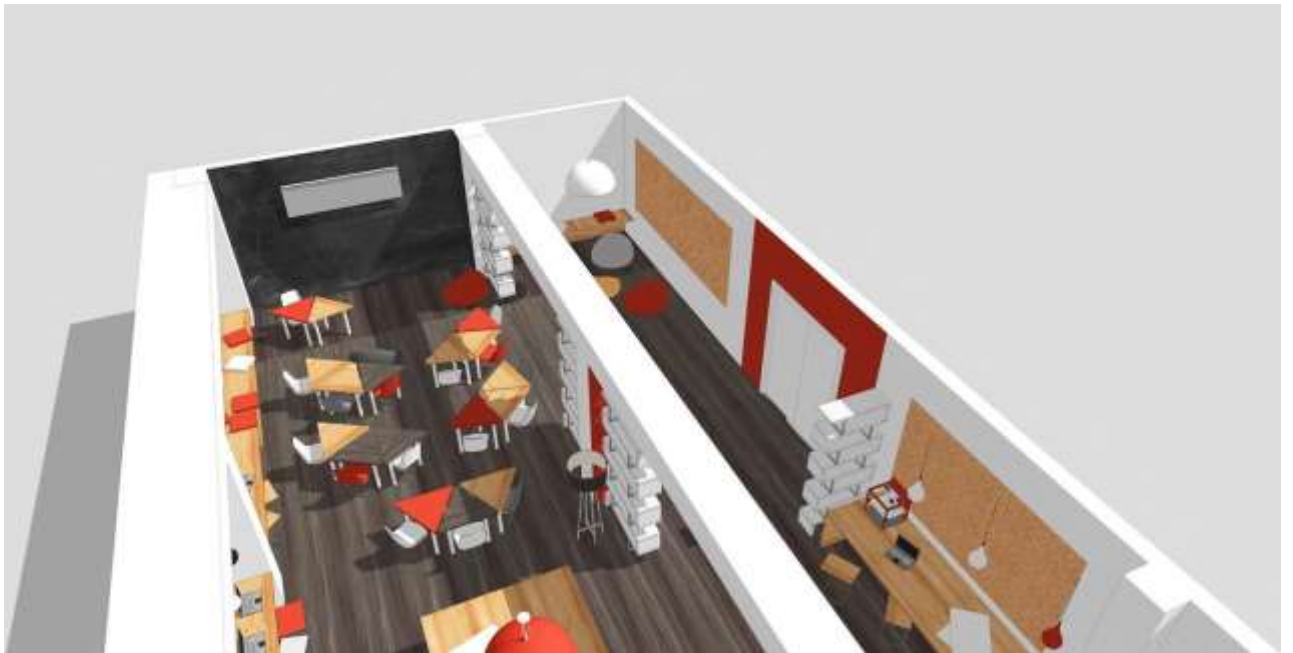
Аудитория: рабочие места, меловая стена.