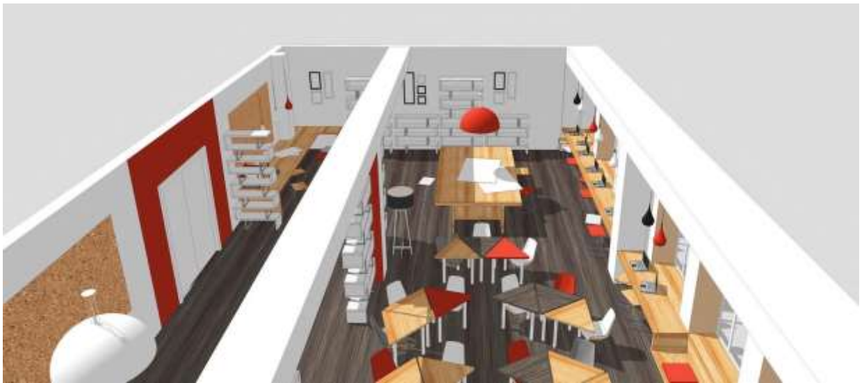
Аудитория: меловая стена, экран, маркерная поверхность, пробка, 3d-принтер.